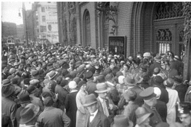
Berlín, julio 13 de 1931.