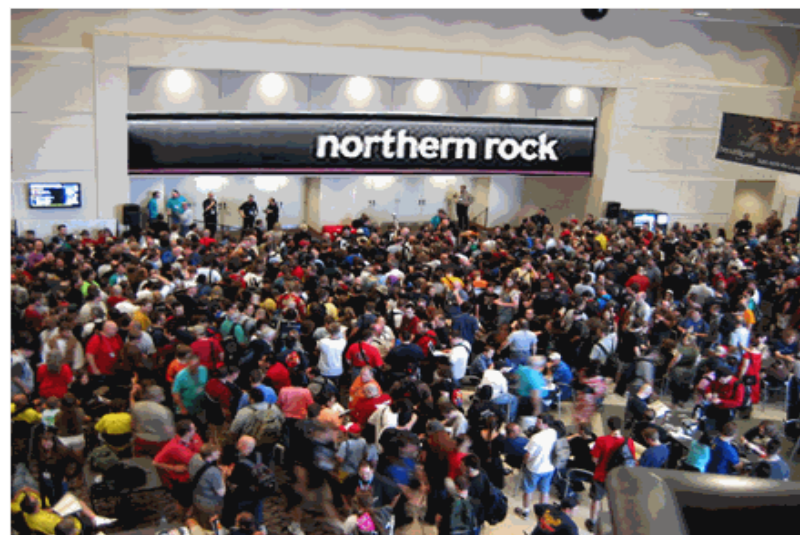
París, diciembre 7 de 2010.